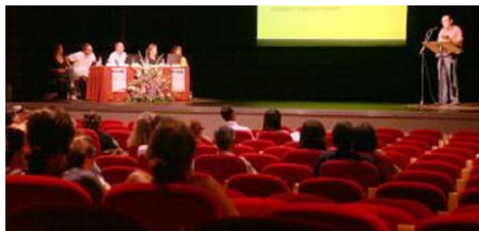
Imagen de las Jornadas Pro Salud Mental del año pasado.