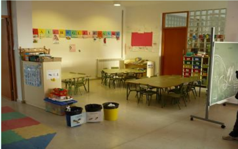
Foto2: detalle de un aula ordinaria de Educación Infantil del CEIP Venda d'Arabí (Sta. Eulalia)

Foto1: detalle de un aula ordinaria de Educación Infantil del CEIP S'Olivera (Sta. Eulalia)