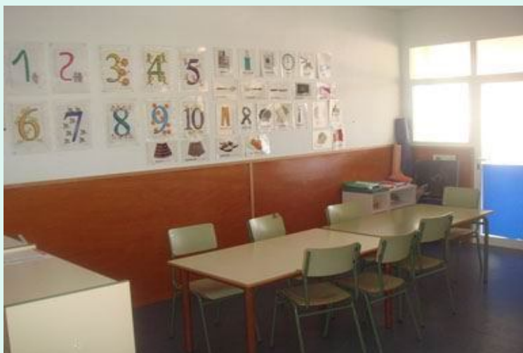
Foto2: detalle de un aula ordinaria de Educación Primaria del CEIP Sa Blancadona (Ibiza)

Foto1: detalle del ASCE del CEIP Sa Blancadona (Ibiza)